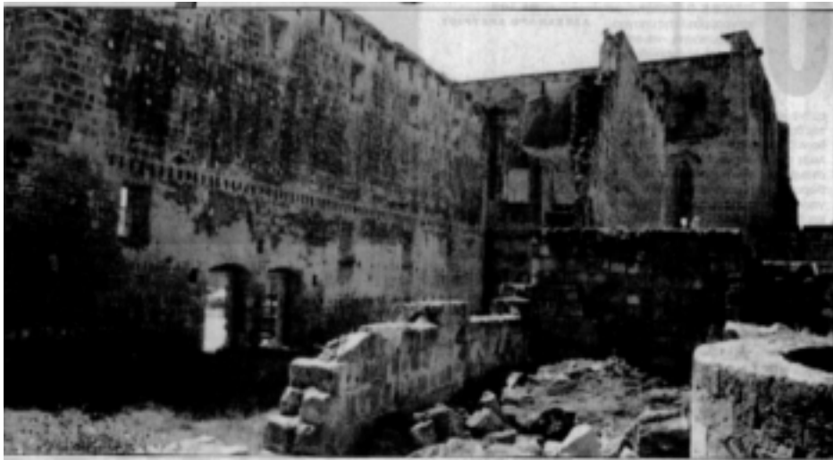
ΦΙΛΕΛΕΥΘΕΡΟΣ ΠΟΛΙΤΙΣΜΟΣ Sunday, 29 February 2004, p. 1

χρεώσεις της Ηνωμένης Κυπριακής Δημοκρατίας, εξηγεί, όπως απορρέουν από διεθνείς συνθήκες θα εφαρμόζονται από την ομοσπονδιακή κυβέρνηση ή την αρχή του συνιστώντος κράτος στο οποίο αφορά η σχετική συνθήκη. Παράλληλα, η περιουσία της Εκκλησίας της Κύπρου δεν πρόκειται να επηρεαστεί από καμιά εδαφική αναπροσαρμογή, σε περίπτωση λύσης του Κυπριακού και ως εκ τούτου, όλοι οι ναοί, τα μοναστήρια, τα τζαμιά και γενικά τα θρησκευτικά μνημεία, θα περιέλθουν και πάλιν στην κατοχή των ιδιοκτητών τους.