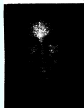
Της Νάσας Παταπίου*

Σ τα Κρατικά Αρχεία Βενετίας και στη σχετική αρχειακή σειρά η οποία αναφέρεται στα οχυρωματικά έργα, σώζονται δύο τοπογραφικά σχεδιαγράμματα των οχυρώσεων της Κερύνειας, τα οποία είχαν εκπονηθεί το έτος 1562 όταν υπηρετούσε ως Γενικός Προνοητής και Σύνδικος Κύπρου ο Ιωάννης Ματθαίος Bembo. Τα δύο τοπογραφικά σχεδιαγράμματα φέρουν την υπογραφή ενός άγνωστου στη σχετική βιβλιογραφία μηχανικού. Ένα σχεδιάγραμμα των Αλυκών Λάρνακας (Saline) φέρει επίσης την υπογραφή του ίδιου μηχανικού. Επιπρόσθετα στη Μαρκιανή Βιβλιοθήκη